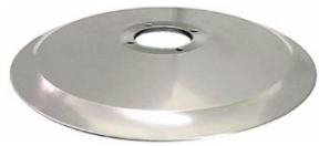
I Dos bombé