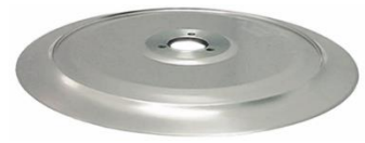
II Arête circulaire au dos